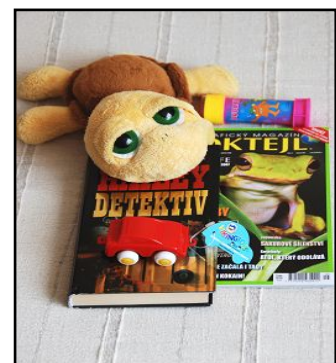
Obr.: Volný čas

V páté skupině je důležitý především mobilní telefon s nabíječkou, FM rádio (stačí ve formě MP3 přehrávače, discmanu apod.) s nabíječkou nebo bateriemi, svítilna, zavírací nůž, šití, psací potřeby a dále předměty pro vyplnění volného času – knihy, hračky pro děti, společenské hry .