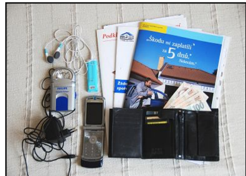
Obr.: Dokumenty, peníze, mobil + nabíječka, svítilna, MP3

Do druhé skupiny řadíme osobní dokumenty ( rodný list, občanský průkaz, cestovní pas, kartu zdravotní pojišťovny ), jiné důležité dokumenty ( pojistné smlouvy, stavební spoření, smlouvy o investicích, akcie ) a peníze v hotovosti + platební karty .