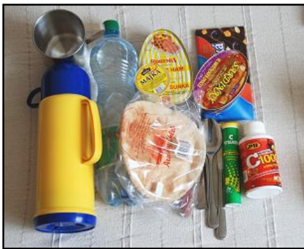
Obr.: Jídlo, pití + nádobí

Do první skupiny patří zejména trvanlivé a dobře zabalené potraviny, pitná voda (vše na 2-3 dny pro každého člena domácnosti), krmivo pro domácí zvíře, které berete s sebou, hrnek nebo miska, příbor a otvírák na konzervy . V případě, že máte individuální dietetický režim (např. bezlepková dieta, vegetariánství apod.), počítejte s tím, že v místech náhradního ubytování s hromadným zajištěním stravování bude možné Vám vyjít vstříc jen v omezené míře. Mějte tedy své speciální potraviny s sebou v dostatečném množství.