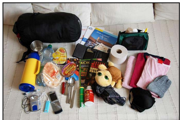
Obr.: Obsah evakuačního zavazadla