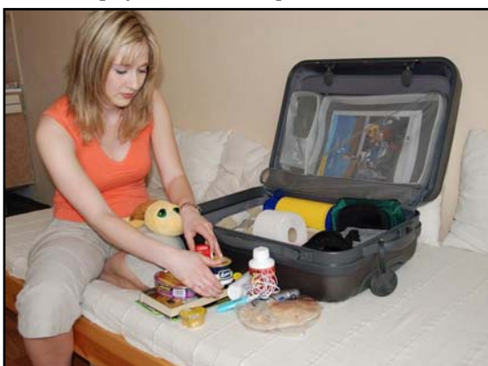
Obr.: Balení evakuačního zavazadla

Je velmi pravděpodobné, že při vyhlášení evakuace budete v časové tísně a stresu. Při balení proto zvažujte priority. Obecně nejdůležitější jsou předměty, zařazené do druhé a třetí skupiny. Vše ostatní Vám může v případě nouze někdo v místě náhradního ubytování půjčit.